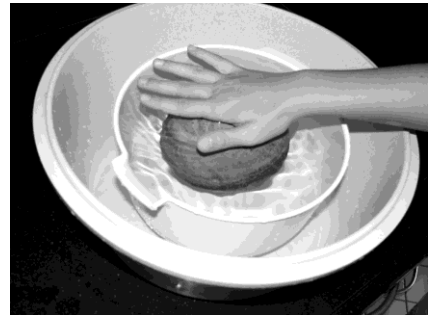
Luuk dompelt de bal onder water.

Luuk bepaalt het volume van de vijverbol met twee schalen uit een keukenkast. Zie de tekeningen hieronder.