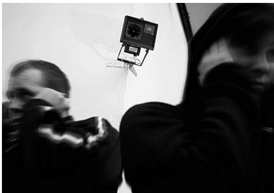
De Mosquito verdrijft jongeren.

Jongeren tussen 10 en 19 jaar veroorzaken soms overlast. Er bestaat een apparaat: de Mosquito ( Engels voor mug ) dat jongeren kan verdrijven.