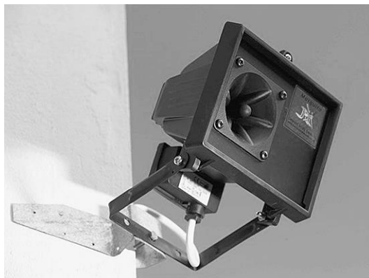
De Mosquito van dichtbij.

Het apparaat verjaagt jongeren met geluidsgolven. In de handleiding van de Mosquito staat een diagram van de frequenties die je bij een bepaalde leeftijd kunt horen. Dit diagram zie je hieronder.