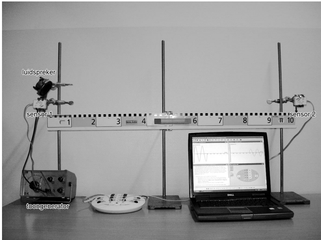
een opstelling voor het bepalen van de geluidssnelheid