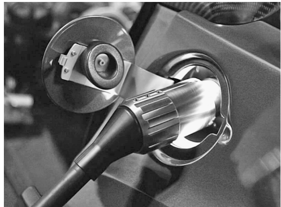
het 'bijtanken' van de auto