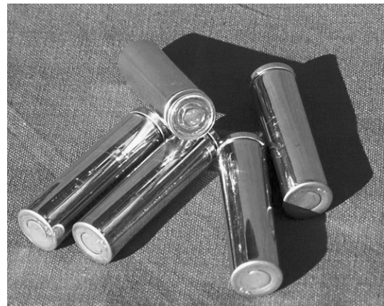
de oplaadbare batterijen in het batterijpack