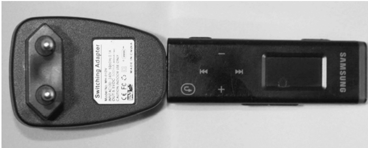
mp3-speler aan de USB-oplader

Een mp3-speler met USB-aansluiting is op te laden via de computer. Voor op reis is een USB-oplader op netspanning te koop.