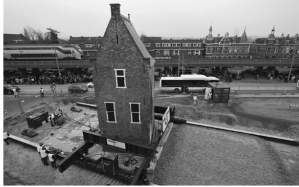
Bagijnetoren op zijn nieuwe fundering

De nieuwe fundering van beton was nodig om de toren in zijn geheel te kunnen verplaatsen.