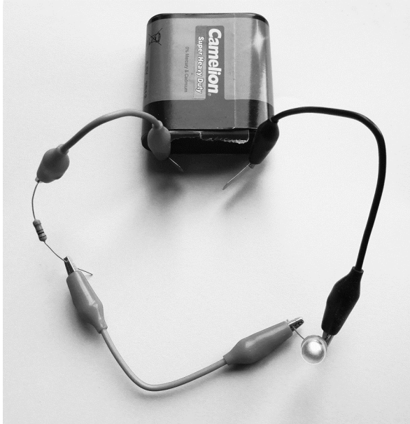
de schakeling van Donna

Donna bouwt tijdens de natuurkundeles een schakeling met een batterij, een LED en een weerstand.