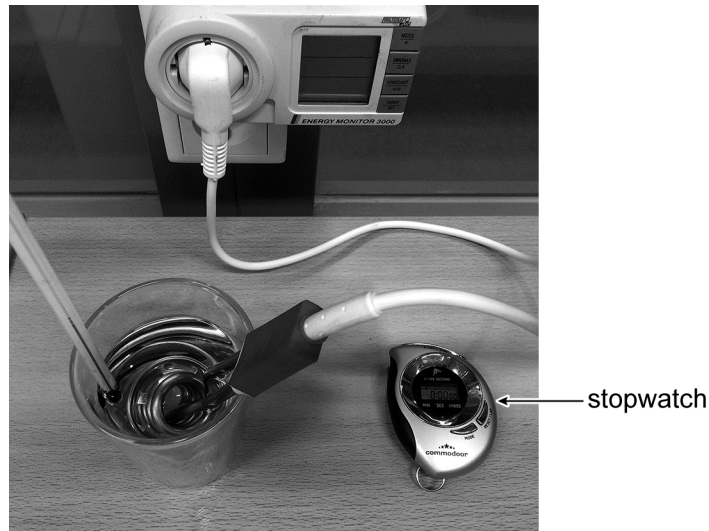
de opstelling voor de proef

Doede en Emiel onderzoeken tijdens de natuurkundeles het verband tussen energie en temperatuur. Zij gebruiken bij de meting een energiemeter en een thermometer. In een dubbelwandig theeglas zetten zij de thermometer en een dompelaar als verwarmingselement.